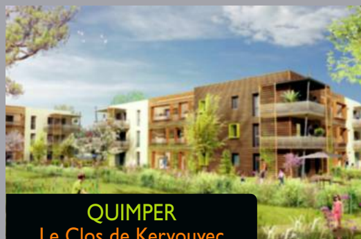
QUIMPER Le Clos de Kervouyec