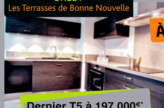
BREST Les Terrasses de Bonne Nouvelle