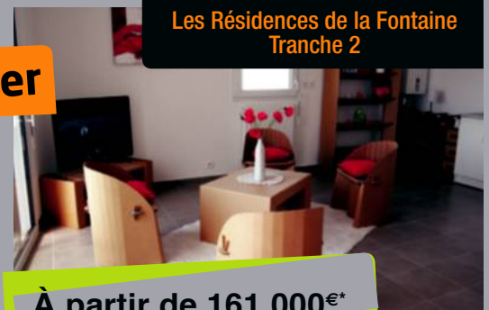
PLOUGASTEL-DAOULAS Les Résidences de la Fontaine Tranche 2