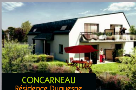
CONCARNEAU Résidence Duquesne