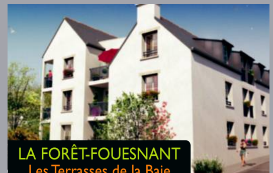
LA FORÊT-FOUESNANT Les Terrasses de la Baie