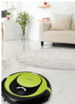
Les robots aspirateurs : pas forcément puissants, mais si serviables !

Bien loin des méchantes machines que nous prédisent parfois les films de science-fiction, les robots d'aujourd'hui nous rendent de multiples services.