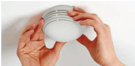
La pose d'un détecteur de fumée sera obligatoire le 9 mars prochain.

Un incendie toutes les deux minutes, 800 décès par an : il suffit de consulter les statistiques françaises sur les incendies pour comprendre qu'il était temps d'agir pour améliorer la protection des logements contre le feu. Ce sera chose faite le 9 mars 2015, date à partir de laquelle tout lieu d'habitation devra être équipé d'un détecteur autonome avertisseur de fumée (DAAF). Il est conçu pour détecter les incendies dès les premières émissions de fumée et émettre immédiatement un signal sonore assez puissant pour réveiller une personne endormie dans le logement. En effet, la majorité des incendies mortels ont lieu la nuit : les victimes sont surprises dans leur sommeil et succombent par asphyxie.