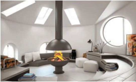
Le chauffage au bois (insert, chaudière, cheminée fermée) reste moins coûteux que les autres combustibles fossiles (pétrole, charbon, gaz...).

Il existe différents types de chauffages écologiques qui permettent de faire des économies sur votre facture d'électricité : chauffage solaire, pompe à chaleur, ou chauffage au bois. Toutes ces solutions sont plus onéreuses à l'installation que les modes de chauffage « traditionnels » (radiateurs électriques et chaudière gaz/fioul), mais se rentabilisent vite au fonctionnement. En outre, elles ouvrent le droit à un crédit d'impôt de 30 %.