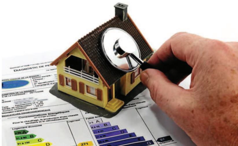
L'établissement d'un diagnostic de performance énergétique vous indiquera dans quelle classe se place votre logement.