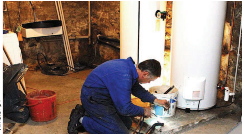
Les systèmes comme les pompes à chaleur (électriques) tendent à se développer.