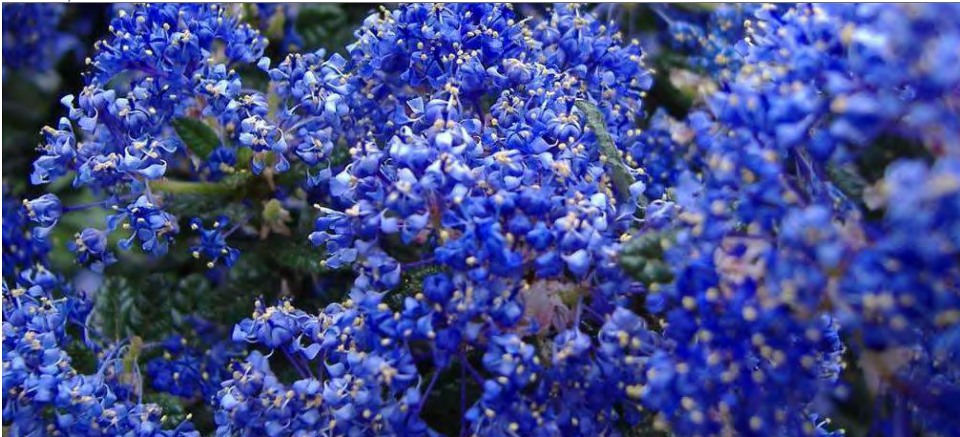
Le céanothe bleu fait partie des variétés de plantes qui supportent bien le sel et le vent.