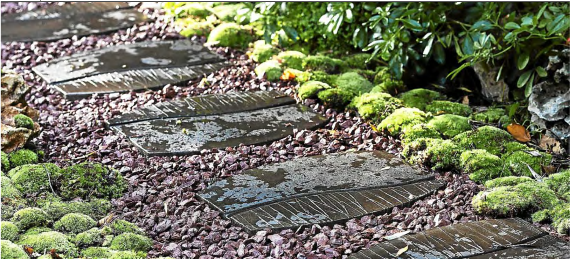
Pour pouvoir facilement accéder aux parterres de grandes dimensions, de petits sentiers aménagés entre les plantations sont toujours très utiles.