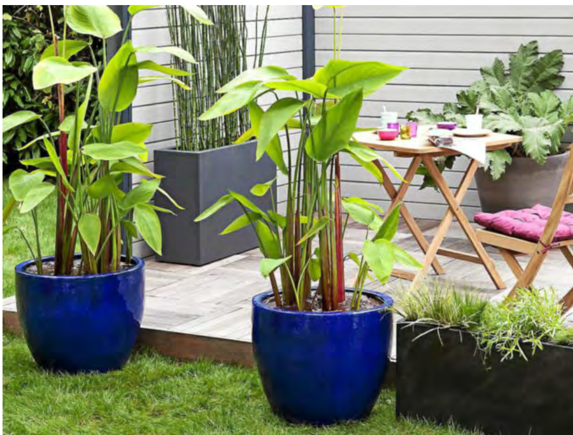
Tout autour de la terrasse, les pots et jardinières doivent être choisis de manière à être en harmonie avec votre jardin.

Les humains ne sont pas les seuls à habiter le jardin : de nombreux animaux y ont aussi élu domicile. Pour fidéliser les plus charmants et les plus utiles d'entre eux, il existe quelques accessoires que l'on peut se procurer en jardinerie. Pour les oiseaux, les articles ne manquent pas : des abreuvoirs, des mangeoires ou ces nichoirs à installer