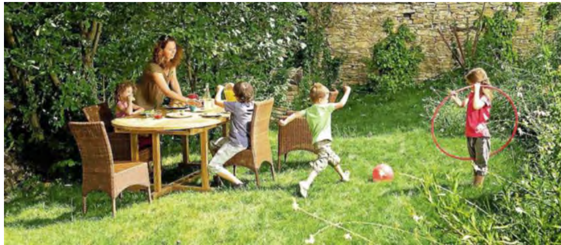
Si la pelouse doit être beaucoup utilisée pour les jeux ou accueillir des transats, choisissez un gazon adapté et bien résistant.

Un gazon bien entretenu fait la fierté du jardinier et l'admiration de ses voisins ! Il est vrai que ce tapis vert qui semble si naturel demande de l'attention et du travail durant toute la belle saison. Suivez nos conseils, et n'oubliez pas de l'entourer de fleurs !