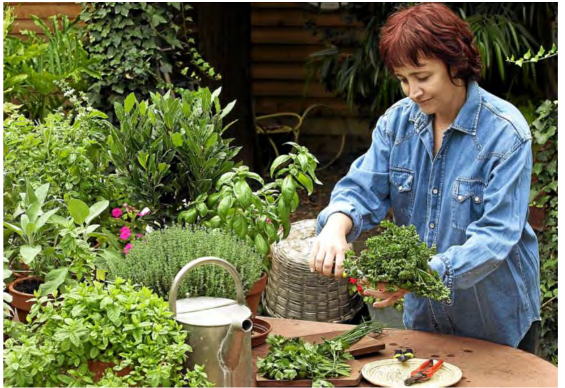
Les plantes aromatiques embaument le jardin comme les plats en cuisine. Elles se cultivent aussi bien en pleine terre qu'en pot.

Les aromates se cultivent facilement, s'utilisent de mille manières et sont gorgés de vitamines et minéraux. Il est donc temps de vous en composer un ou deux petits massifs ! Ombre ou soleil, humidité ou sécheresse, terre grasse ou rocaille... Chacune devra y trouver sa place !