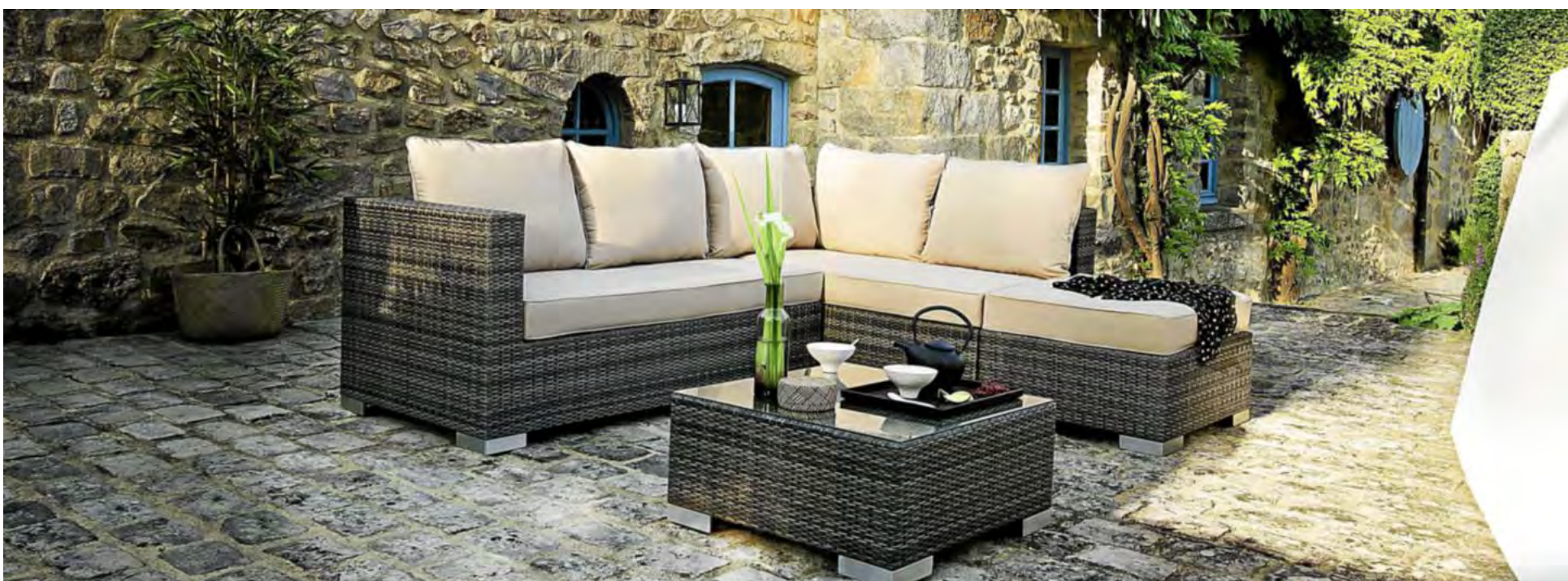
Les dallages fixes de pierre naturelle, de briques, de béton ou de céramique, résistent aux intempéries et se nettoient facilement.