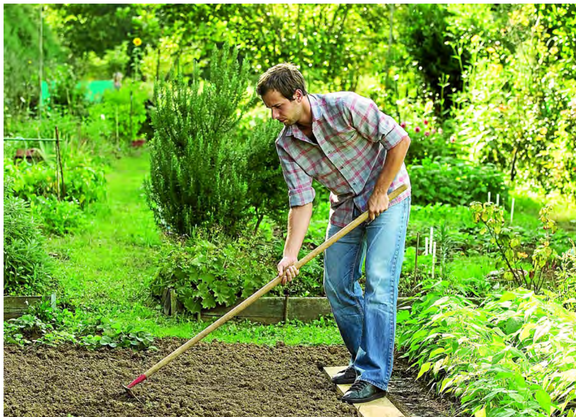
Pour éviter de la piétiner, effectuez tous les travaux depuis la bordure de la plate-bande ou posez des planches pour marcher dessus.

Les indicateurs sont au vert : les godets garnis de jeunes plants de légumes de printemps remplissent les étals des jardineries, et, avec un soleil plus généreux, le sol est bien sec. C'est le moment de commencer à planter les salades, les choux et les premières herbes aromatiques.