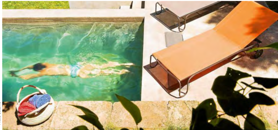
La piscine constitue pour beaucoup d'entre nous un rêve à réaliser. Rêve devenu désormais accessible grâce à un large choix de modèles, adapté à toutes les bourses.

Encore relativement rare en Bretagne, la piscine constitue pourtant un atout indéniable pour le jardin et la maison. Longtemps considérée comme un luxe, elle est aujourd'hui plus accessible. Variant les formes et les matières, elle est facile à intégrer dans votre paysage.