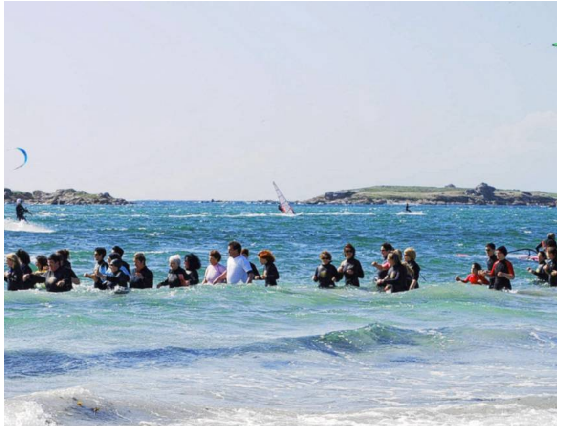
L'eau fraîche active la circulation sanguine et favorise un meilleur retour veineux.

Pour cet été, vous cherchez des activités autres que la marche à pied ou le vélo ? Laissez-vous tenter par deux disciplines aussi récentes que tendance : le long-côte et le stand-up paddle.