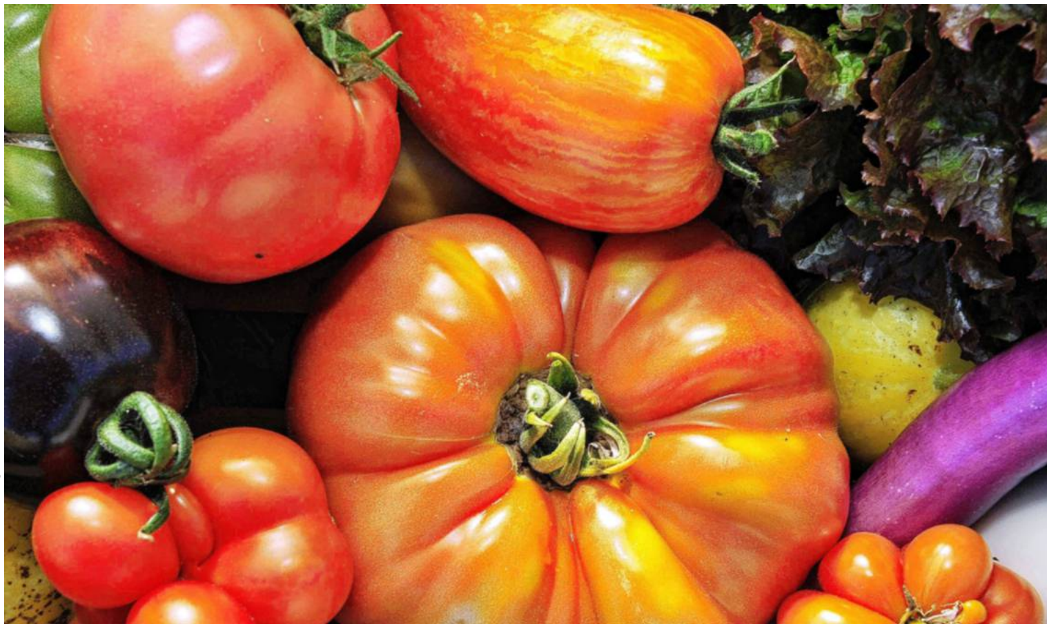
En plus de leur richesse en vitamines, les fruits et légumes apportent des fibres, essentielles au confort digestif.

Ballonnements, douleurs d'estomac et gargouillis divers... Vos fins de repas relèvent parfois de la torture ? Et si vous changiez vos habitudes ? Bien souvent, les causes d'une mauvaise digestion se trouvent dans notre quotidien. Une alimentation trop riche, une hydratation insuffisante, des repas avalés sur le pouce ou le stress sont autant de responsables à ces maux de tous les jours.