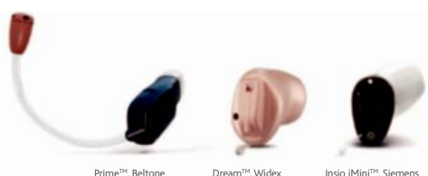
Prime™, Beltone Dream™, Widex Insiio iMini™, Siemens

Les aides auditives qui se font naturellement oublier.