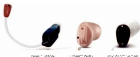
Prime™, Beltone Dream™, Widex Inzio iMini™, Siemens

Les aides auditives qui se font naturellement oublier.